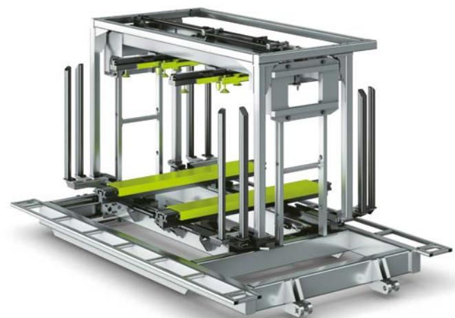
Einbaugerät für Kommissionierfahrzeug